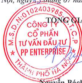
Đặng Quốc Thái